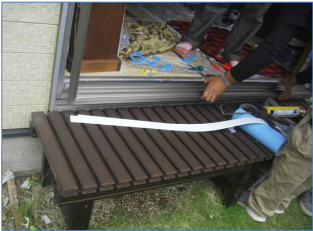
3. 新たに枠を取り付けていきます。