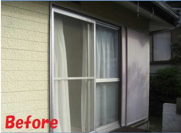
1. 着工前 カバ-工法で既存のサッシを外さず施工していきます。