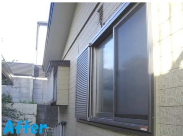
5. 雨戸一筋と雨戸を取付けが完了しました。