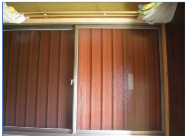
6. 内枠に押し打ち、完了です。