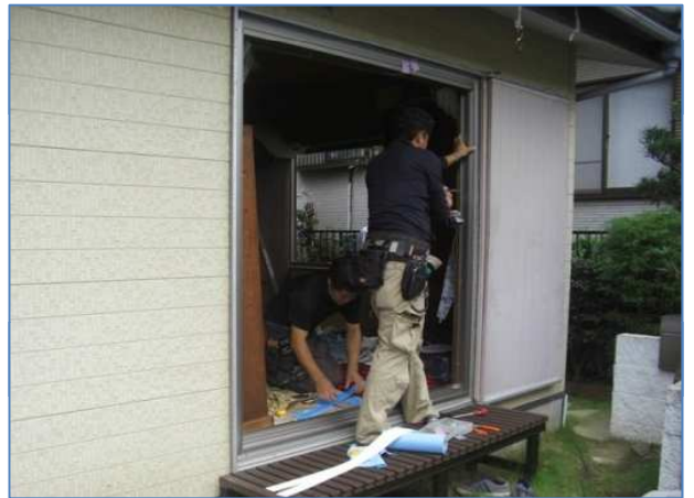
4. 枠を取り付けている様子。