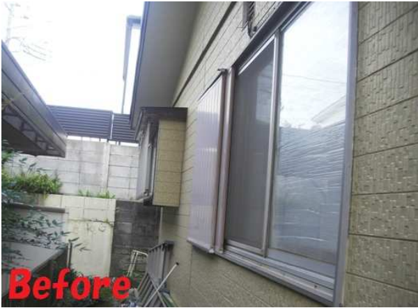
1. 窓枠取付け前の様子