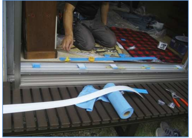
2. 既存サッシにパッキンを取付けています。