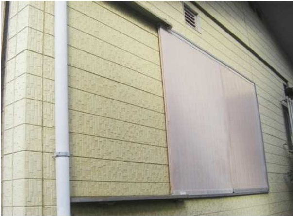
1. 雨戸一筋・内枠の取付け前の様子。