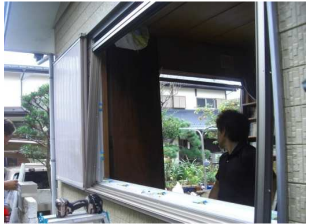
2. 内枠を取り付けています。