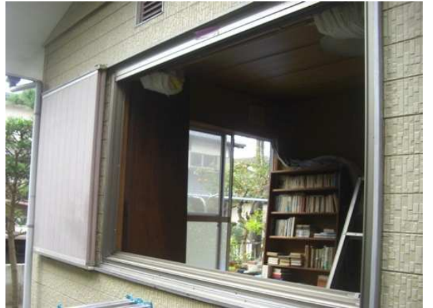
4. 内枠が取付け完了しました。