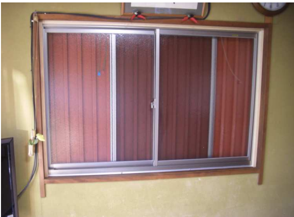
3. カバー工法でサッシ、押し打ち取付けが完了しました。