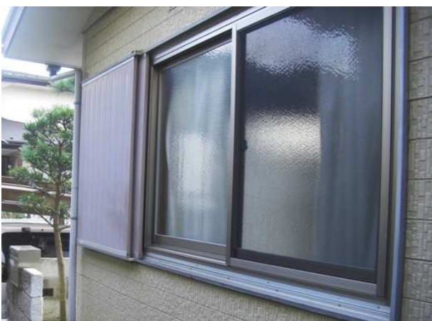
5. ガラス障子が入りました。