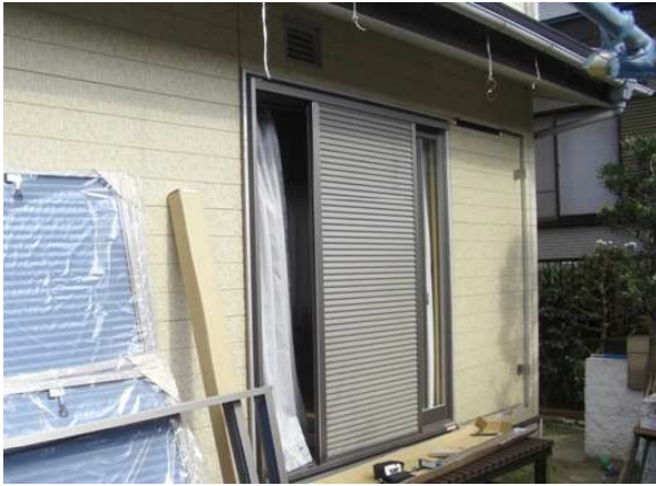
7. 雨戸も交換していきます。 雨戸一筋枠を取り付けていきます。