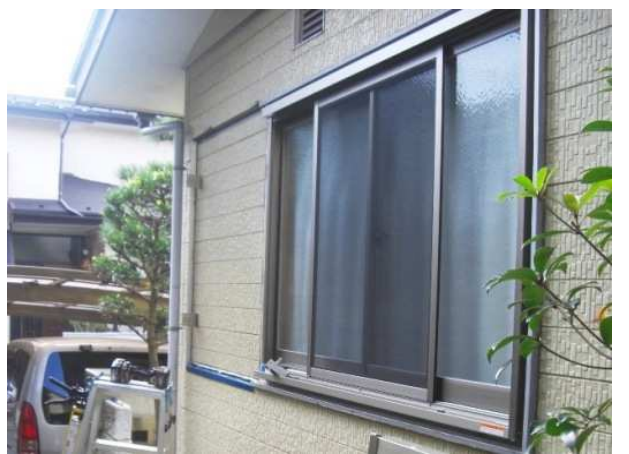
6. 雨戸一筋を取り付けていきます。