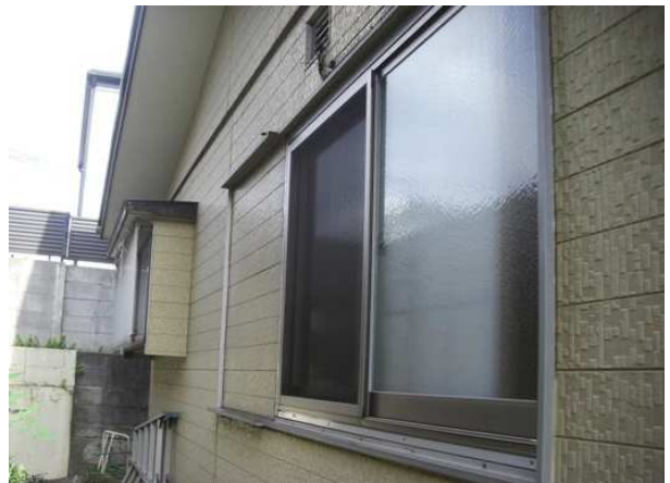
4. 雨戸一筋を取付けていきます。 施工前の様子です。