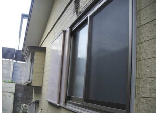
2. 窓枠内の障子を取付けました。