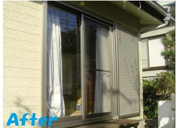
8. 雨戸一筋と雨戸の取付けが完了しました。